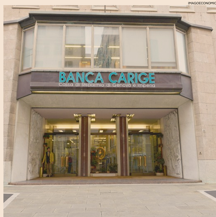
Carige. Per il gruppo del credito cooperativo Ccb un'opzione call sull'80%

Ma non basta. Perché c'è un altro aspetto, anch'esso tutto da definire, che è rappresentato dall'effetto degli esami Bce. La holding trentina, al pari di Iccrea, è nel pieno del Comprehensive Assessment, esame formato dalla verifica degli attivi (Aqr) e dagli stress test. Un banco di prova, quest'ultimo, che rischia di rivelarsi un passaggio delicato. In particolare per come sarebbero disegnati gli scenari